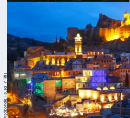
traditionelle Häuser in Tiflis