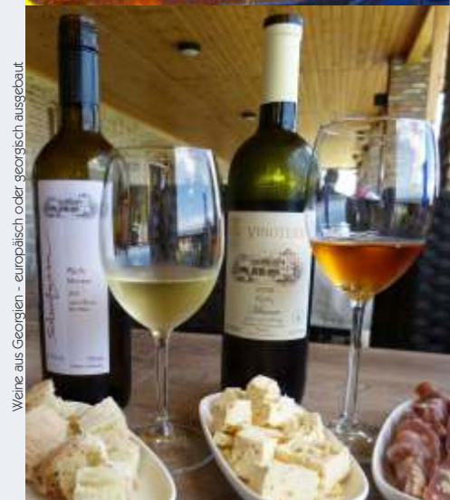
Weine aus Georgien - europäisch oder georgisch ausgebaut