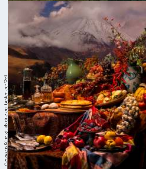
Georgiens Küche gilt als eine der besten der Welt