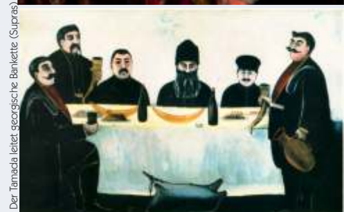
Der Tamada leitet georgische Bankette (Supras)